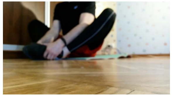
Рис. 2б. Розміщення перед камерою №2

Також у кадрі розміщується ввімкнений секундомір, або годинник таким чином, щоб було добре видно секунди та хвилини під час виконання вправ (рис. 3).